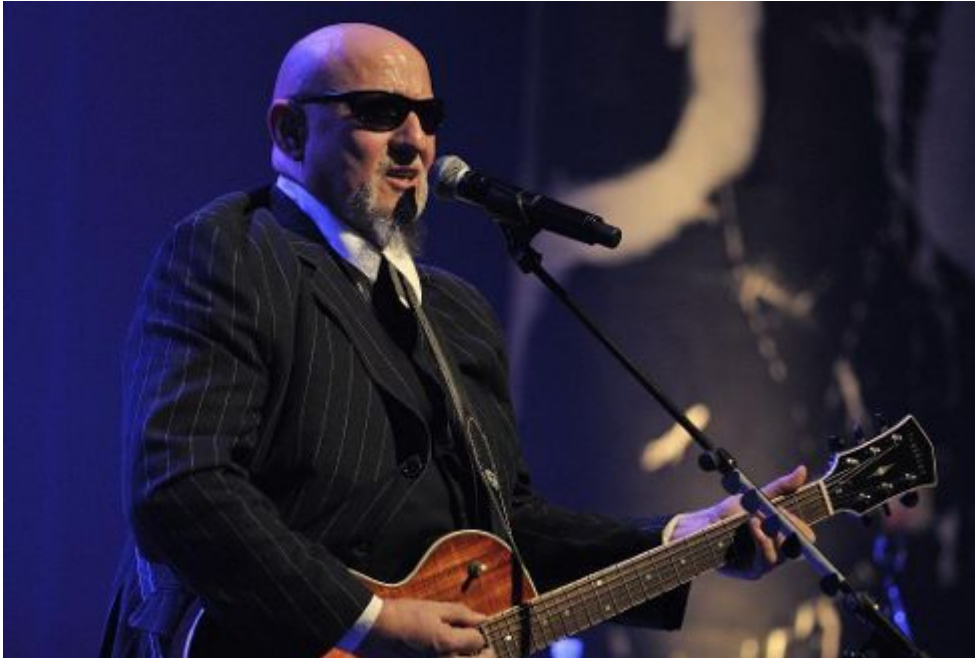
Charlélie Couture à Chécy

Chaque année, c'est la même chanson. Belle chanson. Et française, forcément. Celle de l'association ABCD et de son Festival de Travers, passionnant cheminement musical et festif à travers toute l'agglomération orléanaise.